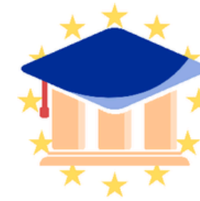
Fundacja Dyplomacji Przyszłości